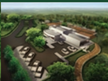
Perspectiva da área de lazer