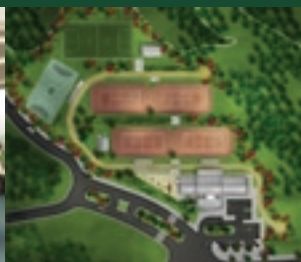
Vista das instalações esportivas