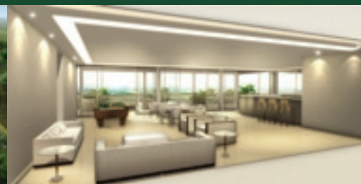
Sala de convivência