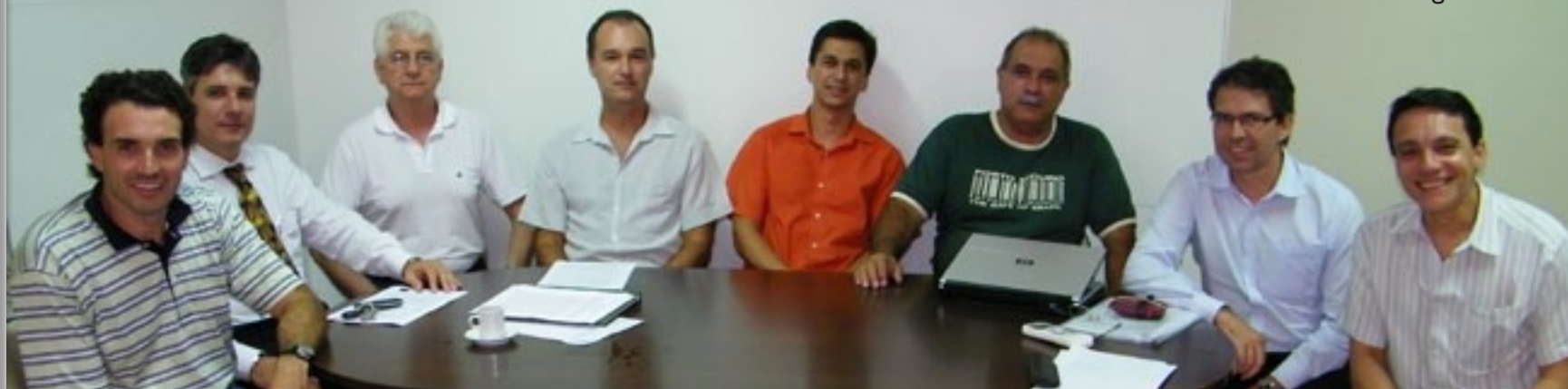
Primeira reunião entre Conselho Consultivo e Deliberativo, Conselho Fiscal e Diretor-Presidente foi realizada em 6 de abril