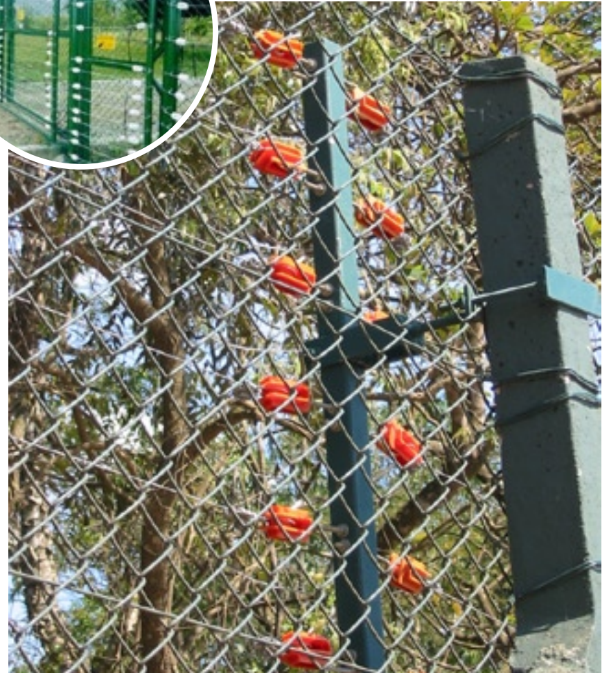
Sistema vai monitorar os seis quilômetros de perímetro do Vale dos Cristais