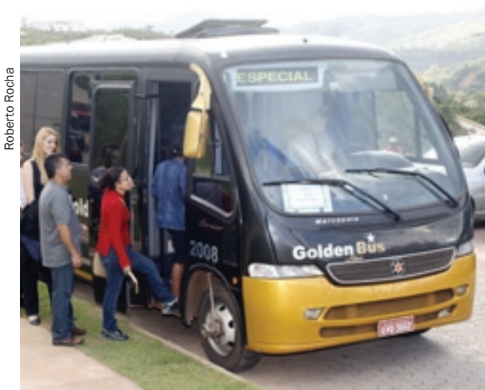
Transporte terá oito horários fixos de viagem

* Aos sábados, os horários das viagens saindo do Vale dos Cristais são 12h, 13h, 14h e 15h.