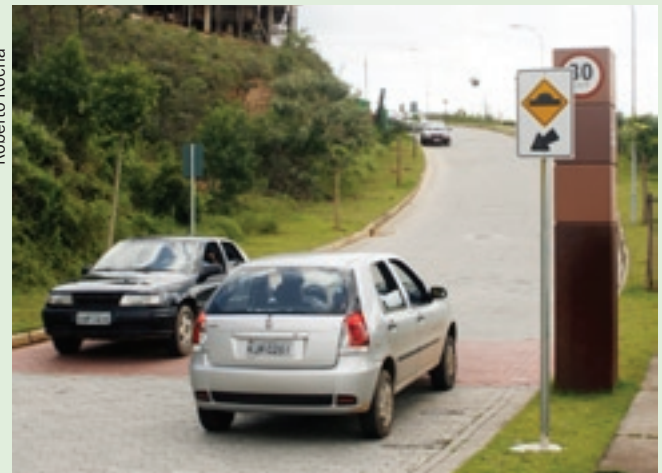
Novos redutores serão instalados em breve no Vale dos Cristais

Redutores de velocidade, que visam a coibir os excessos de alguns motoristas que trafegam pelo Vale dos Cristais, serão instalados em breve nas vias internas do Residencial. A instalação cumpre o plano de trabalho aprovado na AGE de 30.06.08. A decisão foi tomada depois de comprovada a eficácia de um redutor testado desde novembro. Os redutores, que seguem os padrões definidos pelo Conselho Nacional de Trânsito (Contran), serão distribuídos em pontos estratégicos identificados em estudo. Os recursos virão do saldo da conta de investimentos da Associação.