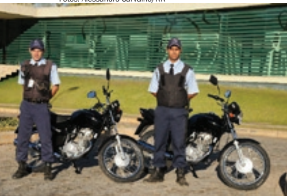
Motos adquiridas pela Associação servem à ronda motorizada 24 horas por dia