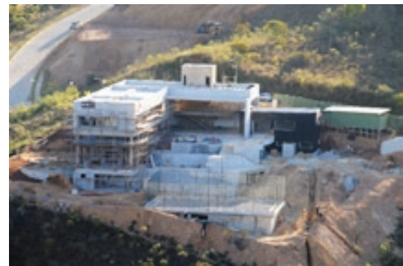
Uma das 63 obras em andamento no Vale dos Cristais – Nascentes