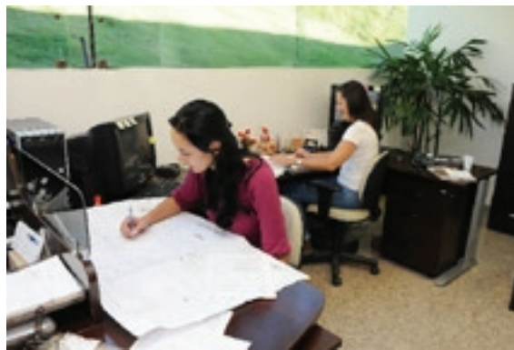
Agora, duas arquitetas são responsáveis pelas análises dos projetos antes do início das obras